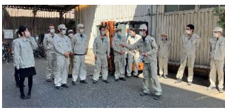
↑ 避難場所での点呼

訓練をしていないと有事の際に体が動かないそうなので、全員が緊張感を持ち、今後も訓練を行います。