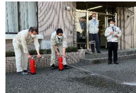
水が入った訓練用消火器にて消火練習をしました。