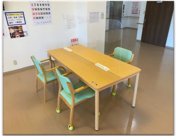
S介護施設(スタンド 1 )