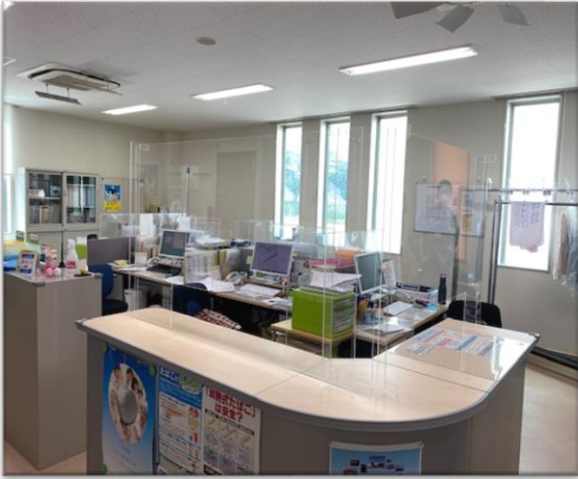
S製薬事務所カウンター(スタンド 2 )